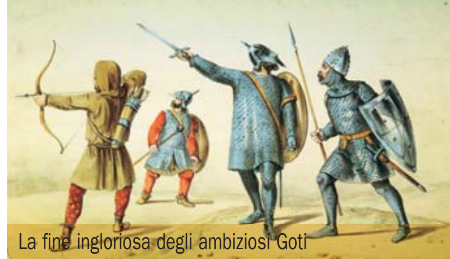
La fine ingloriosa degli ambiziosi Goti

La riconquista dell'Occidente cominciò dal Nord Africa, dove si era stabilita un'orda di Vandali sanguinari e vendicativi. Messa fuori gioco i Vandali, le truppe di Giustiniano, nel 535, sbarcarono in Sicilia e diedero avvio, con un pretesto che non convinse nessuno, a un ventennio di feroci lotte, la cosiddetta guerra gotica: uno scontro di civiltà fra i barbari, che incarnavano il futuro, e l'impero romano d'Oriente, che di romano ormai aveva ben poco. «Le leggi e l'organizzazione erano quelle dell'antica Roma» osserva Carro «ma sui