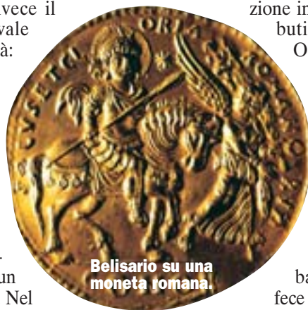
Belisario su una moneta romana.

al quale avevano assicurato protezione in cambio di terre e tributi. Temendo l'ascesa di Odoacre in Italia, Zenone mandò quindi i Goti di re Teodorico a riprendersi la Penisola. Teodorico non fallì e nel 493 stabilì in Italia la prima vera dominazione barbarica della Storia, seppure sotto il controllo di Bisanzio. Il re barbaro, tutto sommato, si fece ben volere: riuscì a far convivere le religioni cattolica e ariana ed evitò scontri con i latifondisti locali. Il problema era che il re, per quanto carismatico, aveva un pessimo rapporto con i numeri. L'economia del Paese, così, si sgretolò.