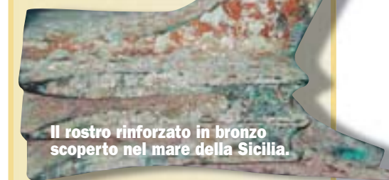
Il rostro rinforzato in bronzo scoperto nel mare della Sicilia.

Scoperte. Tra i pochi ritrovamenti di navi da guerra romane, uno dei più preziosi è un frammento di carena risalente al periodo delle guerre puniche (III-II secolo a. C.) recuperato nel mare di Marsala. Nel 2004, sempre in Sicilia, è stato invece rinvenuto un rarissimo rostro, la prua rinforzata in ferro o in bronzo delle "corazzate": un altro è stato scoperto davanti alle coste israeliane e un terzo al largo di Genova.